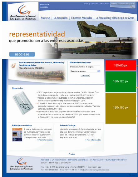
Banner Lateral Pequeño

→ Ejemplo de la ubicación de los banners en la home: