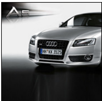
Banner Lateral Grande