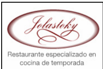
Banner Lateral Mediano